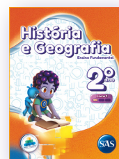
HISTÓRIA E GEOGRAFIA 3 LIVROS PRINCIPAIS