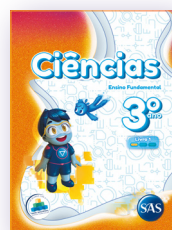
CIÊNCIAS 3 LIVROS PRINCIPAIS