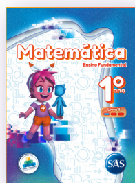
MATEMÁTICA 3 LIVROS PRINCIPAIS