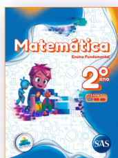
MATEMÁTICA 3 LIVROS PRINCIPAIS