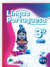
LÍNGUA PORTUGUESA 3 LIVROS PRINCIPAIS