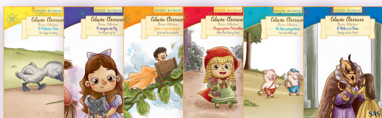
COLEÇÃO CLÁSSICOS DA LITERATURA ATIVIDADES SUPLEMENTARES 1º ANO