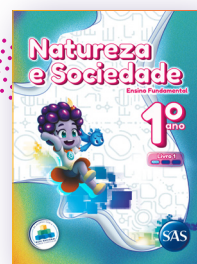
NATUREZA E SOCIEDADE 3 LIVROS PRINCIPAIS