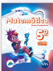
MATEMÁTICA 3 LIVROS PRINCIPAIS