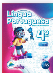
LÍNGUA PORTUGUESA 3 LIVROS PRINCIPAIS