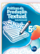
PRÁTICAS DE PRODUÇÃO TEXTUAL ATIVIDADES SUPLEMENTARES 3º, 4º E 5º ANOS