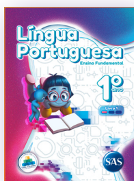
LÍNGUA PORTUGUESA 3 LIVROS PRINCIPAIS