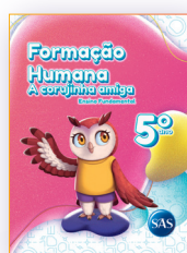
FORMAÇÃO HUMANA ATIVIDADES SUPLEMENTARES 4º E 5º ANOS