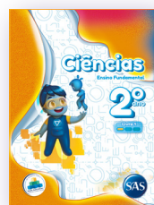
CIÊNCIAS 3 LIVROS PRINCIPAIS