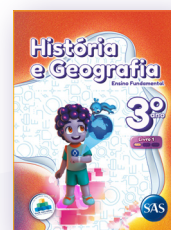
HISTÓRIA E GEOGRAFIA 3 LIVROS PRINCIPAIS