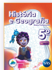
HISTÓRIA E GEOGRAFIA 3 LIVROS PRINCIPAIS