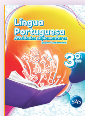
LÍNGUA PORTUGUESA ATIVIDADES SUPLEMENTARES 2º E 3º ANOS