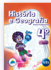
HISTÓRIA E GEOGRAFIA 3 LIVROS PRINCIPAIS