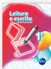
LEITURA E ESCRITA ATIVIDADES SUPLEMENTARES 1º ANO