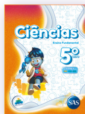
CIÊNCIAS 3 LIVROS PRINCIPAIS