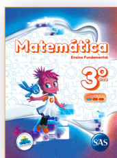
MATEMÁTICA 3 LIVROS PRINCIPAIS