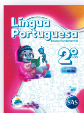
LÍNGUA PORTUGUESA 3 LIVROS PRINCIPAIS