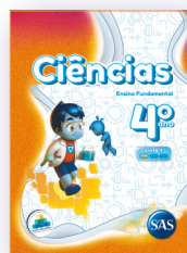
CIÊNCIAS 3 LIVROS PRINCIPAIS