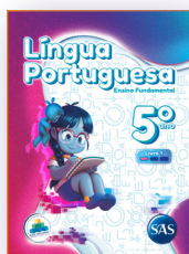
LÍNGUA PORTUGUESA 3 LIVROS PRINCIPAIS