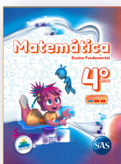
MATEMÁTICA 3 LIVROS PRINCIPAIS